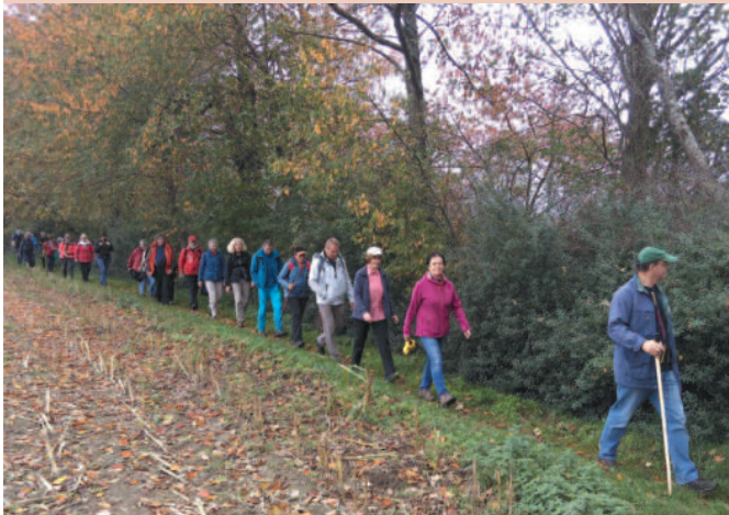
Foto oben: Verbandswanderung 2019 in den Gipsbrüchen von Speerenberg

Bitte besuchen Sie uns auf www.maerkischer-wanderbund.de Hier finden Sie weitere Wanderungen und aktuelle Informationen.